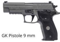
GK Pistole 9 mm