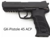
GK-Pistole 45 ACP