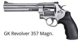
GK Revolver 357 Magn.